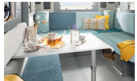
» Skyvbar design-hengebord