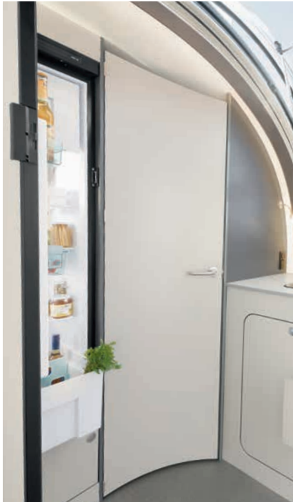
» Stort kjøleskap 142 l og 15 l fryserom