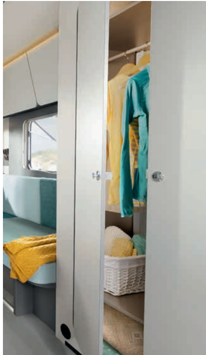
» Romsligt klesskap med klestang og hylle