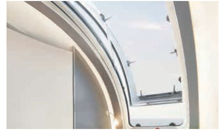
» Stort åpningsbar vindu i front med mørklegning og myggnett plissé (ekstrautstyr / inkl. i Glamping pakke)