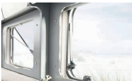
» Attraktive vindu og taklukeramme (ekstrautstyr / inkl. i Glamping pakke)