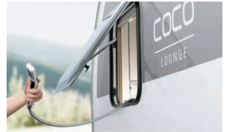
» Åpningsbar vindu i toalettrom med uttrekkbart armatur (ekstrautstyr / inkl. i Glamping pakke)