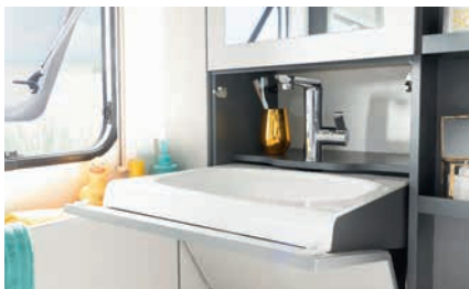
» Plassbesparende vippe-håndvask for enkel oppbevaring i baderomsskapet