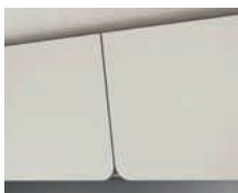
+ Light Grey