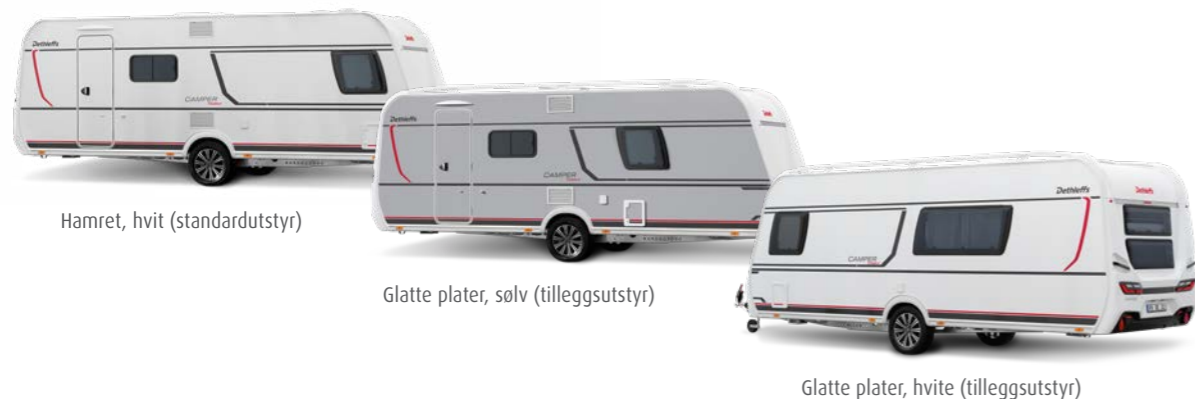
Hamret, hvit (standardutstyr)