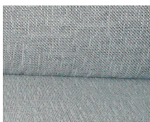
+ Stoffkombinasjon Drake