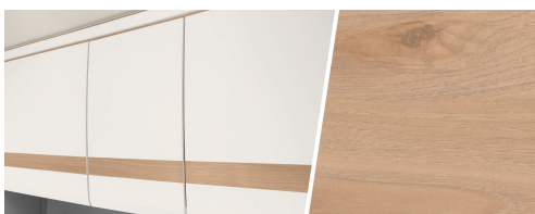
+ Tredekor Noce Nagano