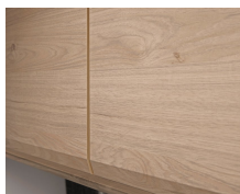
+ Tredekor Noce Nagano