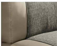
+ Stoffkombinasjon Camino