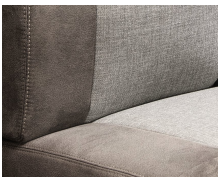
+ Stoffkombinasjon Hygge