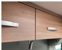
+ Tredekor Cape Town