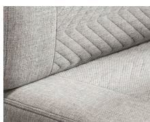
+ Stoffkombinasjon Scandi