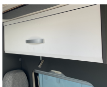
+ Tredekor Amberses Oak, kontrastdekor Trace Dark Grey