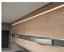
+ Tredekor Noce Nagano, kontrastdekor Web Pebble Grey